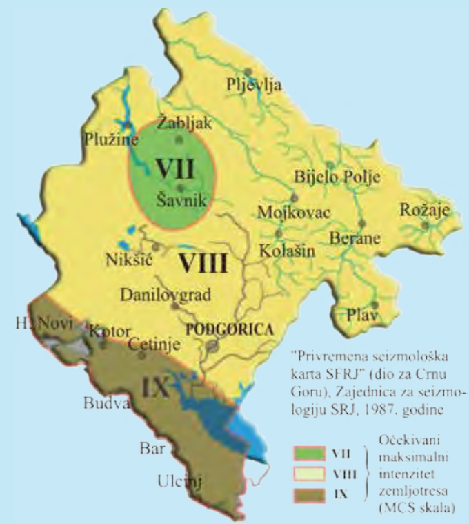
b) za povratne periode od 500 godina