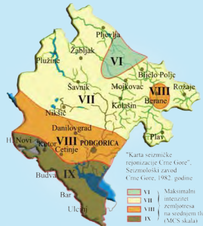
Slika: Karte seizmička rejonizacija Crne Gore (1982): a) za povratne periode od 200